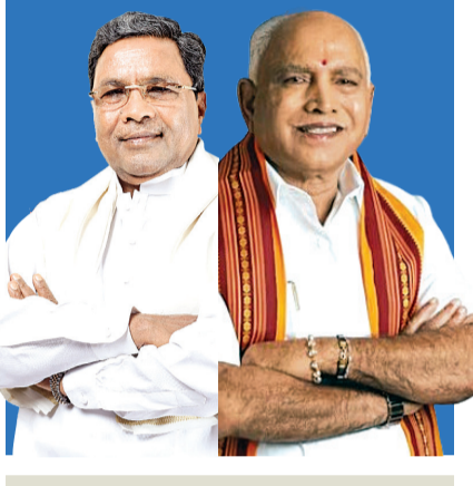
ನಾವು ಕೂಡ ಇದನ್ನು ನಿರೀಕ್ಷಿಸಿ ಮಾಡಿದ್ದೆವು. ಸಿಬಿಐಗೆ ಕೊಡುವ ಅಂತ ಇಲ್ಲ ಅಂತ ಲೋಕಾಯುಕ್ತದ ಮೇಲೆ ವಿಶ್ವಾಸವಿಟ್ಟು ಕೋರ್ಟ್ ಆದೇಶಿಸಿದೆ.

ಬೆಂಗಳೂರು/ಧಾರವಾಡ: ಮುಖ್ಯಮಂತ್ರಿ ಸಿದ್ದರಾಮಯ್ಯ ಹಾಗೂ ಅವರ ಕುಟುಂಬ ಸದಸ್ಯರ ವಿರುದ್ಧದ ಮುಂಡಾ ನಿವೇಶನ ಅಕ್ರಮ ಹಂಚಿಕೆ ಪ್ರಕರಣದ ತನಿಖೆಯನ್ನು ಸಿಬಿಐಗೆ ವಹಿಸಲು ಕೋರಿ ಸಲ್ಲಿಸಲಾಗಿದ್ದ ಅರ್ಜಿಯನ್ನು ಪೋಕ್ಸೊ ವಜಾ ಗೊಳಿಸಿದೆ.